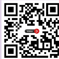
VDO ขั้นตอนการลงทะเบียน ผ่านระบบ DBD e-Filing