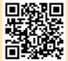
ขั้นตอนการยื่นงบการเงิน ผ่านระบบ DBD e-Filing

สแกนเพื่ออ่านประกาศหลักเกณฑ์และวิธีการยื่นงบการเงิน พ.ศ. 2565 และแนวทางปฏิบัติในการยื่นงบการเงินและบัญชีรายชื่อผู้ถือหุ้น พ.ศ. 2565